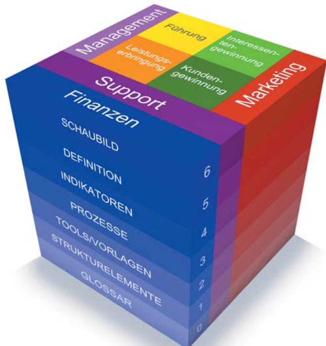
Abbildung 1: Der Makeln21-Würfel

zugänglich werden. Die Navigationsleiste wurde dazu benutzt, Ordner für die acht Hauptprozesse anzulegen, um darin wiederum Vorlagen abzulegen (vgl. Abb. 3).