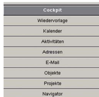
Abbildung 2: Die ursprüngliche Wunderbar